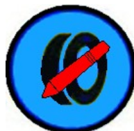
Marcaxe de Pneumáticos