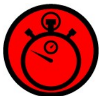
C.H.LL. Treito Crono.