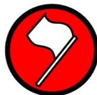
C.H.S. Treito Crono.