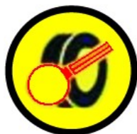
Preaviso Control Marcaxe