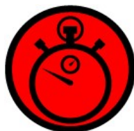
C.H.S. Saída P.T.