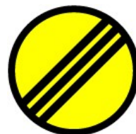
Fin de Zona de Control